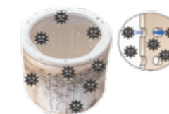
ตัวถังที่มุงจะทำให้เชื้อราบนรูรอบตัวถังเข้าไปเกาะติดเสื้อผ้า