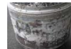
ตัวถังภายนอกเต็มไปด้วยคราบผงซักฟอกที่ตกค้างและเป็นที่ย่อยอาศัยของเชื้อรา

ถังซักผ้าทั่วไปเมื่อใช้งานระยะหนึ่ง ตัวถังซักด้านนอกจะเกิดการตกค้างของคราบผงซักฟอกและเชื้อรา ที่พร้อมเกาะติดเสื้อผ้าลูกน้อย ทีโซนถังซักแบบใหม่ไม่มีรูทำให้คุณมั่นใจได้ว่าเสื้อผ้าลูกน้อยของคุณได้รับการปกป้อง ปราศจากเชื้อราทุกครั้งซัก